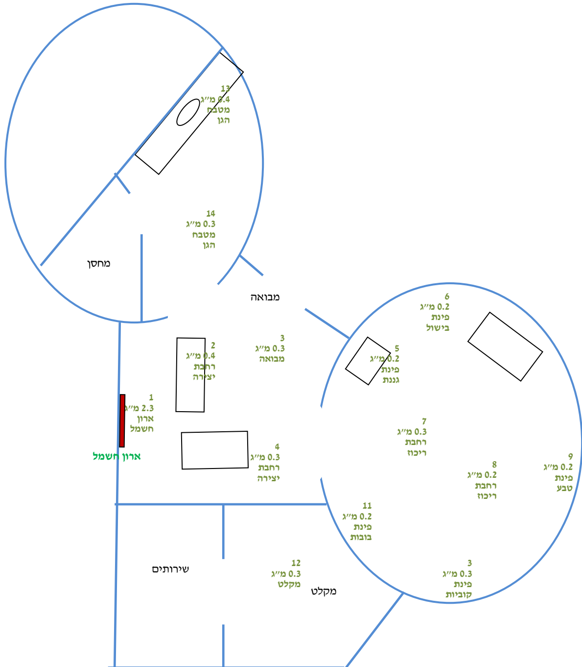
תרשים 1 : תיאור בניין גן הילדים