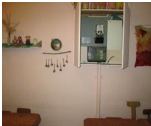
תמונה 2 : אולם הגן